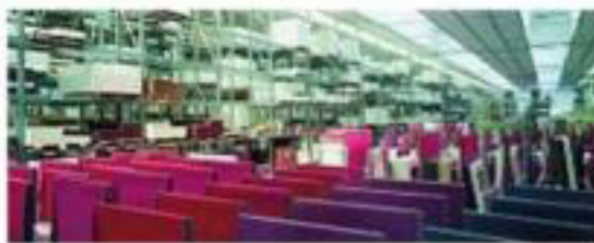
La fabbrica Uno scorcio dell'interno della sede produttiva Scavolini a Montelabbate, nelle Marche