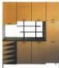
Il precursore Il primo prodotto realizzato dalla Scavolini la credenza buffet Svedese, del 1962, firmata Studio Vuussa (dalle iniziali di Valter Scavolini)