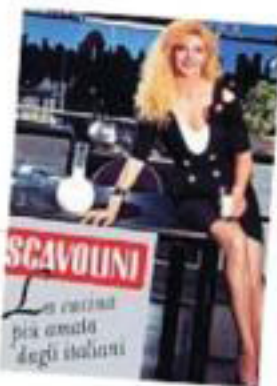
SCAVOLINI La cucina più amata degli italiani