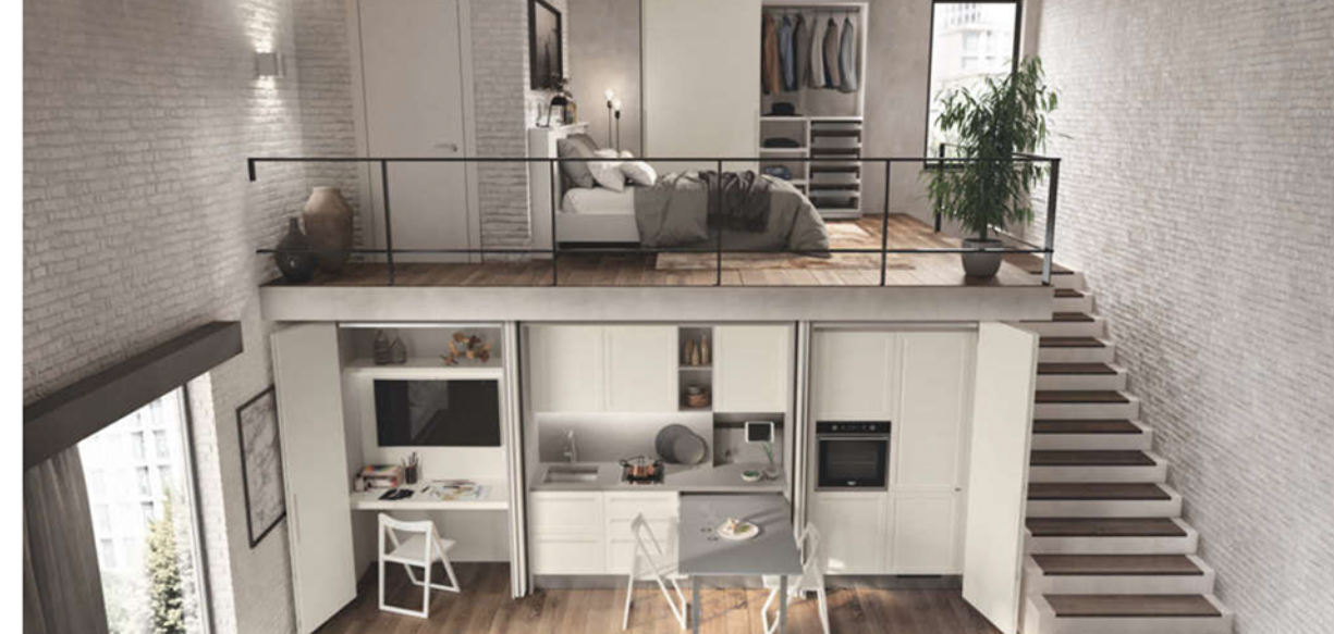
Un alloggio su due piani arredato con BoxLife che integra la cucina Carattere

Un unico progetto e infinite funzioni: è BoxLife, sistema d'arredo che propone speciali armature attrezzate capaci di sostituire le tradizionali funzioni normalmente affidate ai singoli spazi domestici. Progettato da Scavolini e dallo studio di design internazionale Rainlight con il suo direttore creativo Yorgo Lykouria , il sistema BoxLife risponde così all' esigenza sempre più attuale di spazi dinamici capaci di trasformarsi e nascondersi a seconda delle necessità . Un intelligente schema di progettazione di interni completo e modulare , ideale per chi deve fare i conti con vite ad elevata mobilità o metrature sempre più ridotte senza rinunciare al comfort.