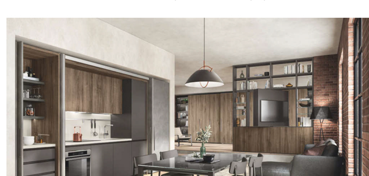
Loft arredato con BoxLife che include la cucina Boxi, Al Il sistema Parete Fluida divide gli ambienti

Novità significativa del programma è l'introduzione della cucina Boxi con la sua declinazione living che entra a pieno diritto nella produzione arredo cucina Scavolini : un concentrato di stile e funzionalità che completa l'eccezionale proposta arredativa di BoxLife.