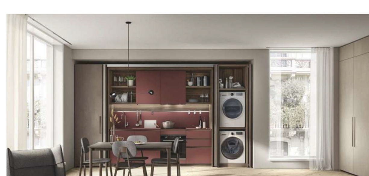
Nel pied à terre arredato con BoxLife, la cucina Boxi presenta ante, piani e schienali in Fenix® Rosso Jaipur

Fortemente indirizzato al mondo contract , BoxLife risponde sia alla richiesta di spazi custom-made sia all'esigenza sempre più diffusa dei progettisti di trovare soluzioni standardizzate per soddisfare gli attuali stili di vita.