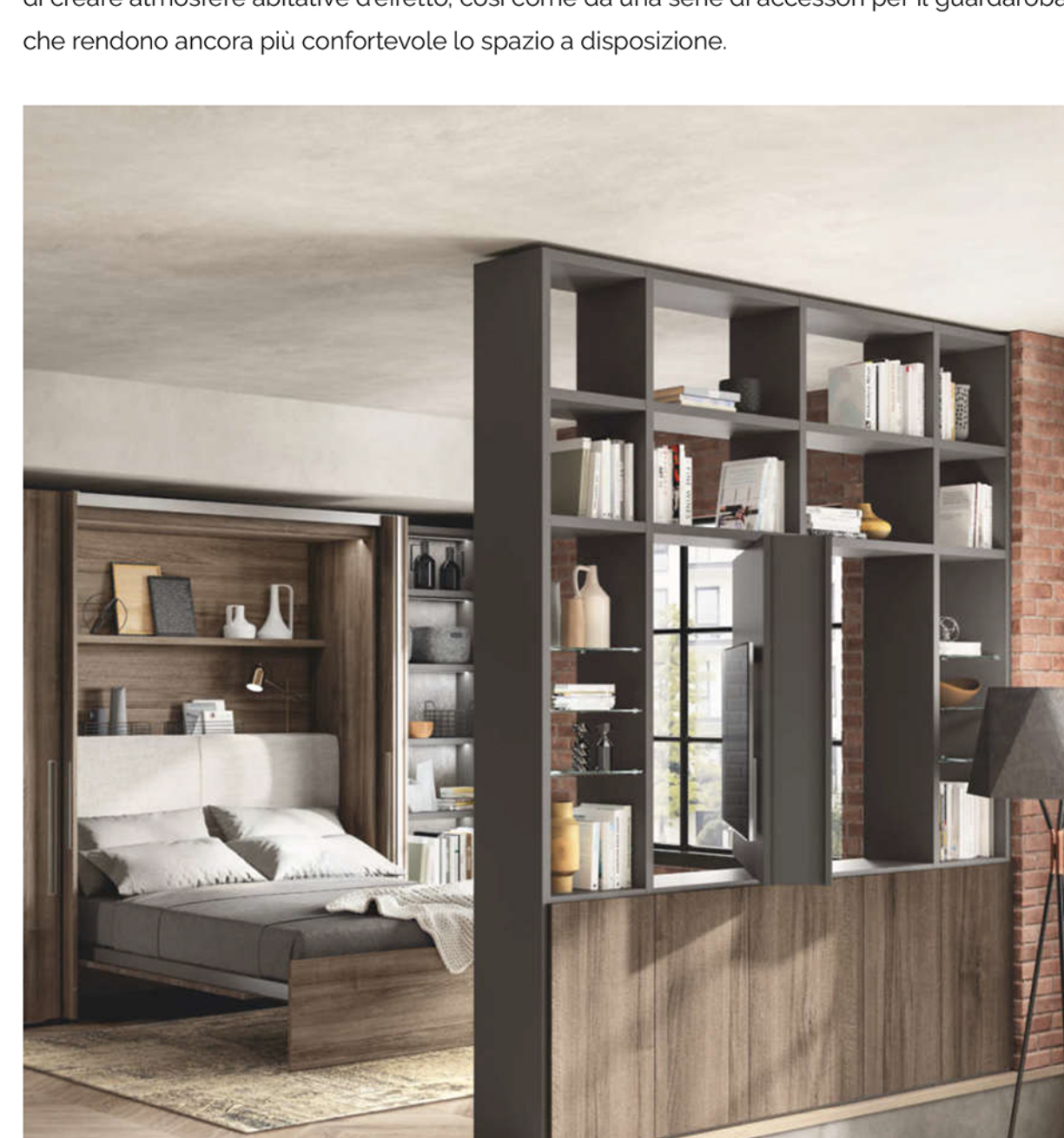
La zona notte creata con BoxLife e il sistema parete Fluida

La zona notte offre numerose tipologie di letti disponibili - matrimoniale, singolo e a castello - e due tipologie di aperture - manuale e motorizzata - per incontrare ogni tipo di necessità. I mobili sono poi corredati da sistemi di illuminazione interni agli armadi, capaci di creare atmosfere abitative d'effetto, così come da una serie di accessori per il guardaroba che rendono ancora più confortevole lo spazio a disposizione.