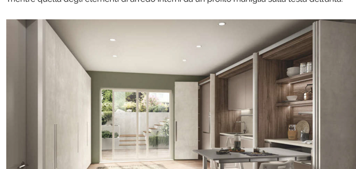
Box Life: la parete-armadio con studio e cucina. Di fronte, la parete-armadio integra la zona notte

Le maniglie e le prese di BoxLife sono state concepite per assicurare comfort e massima continuità stilistica : l'apertura dei pannelli esterni è resa possibile da maniglie a incasso, mentre quella degli elementi di arredo interni da un profilo maniglia sulla testa dell'anta.