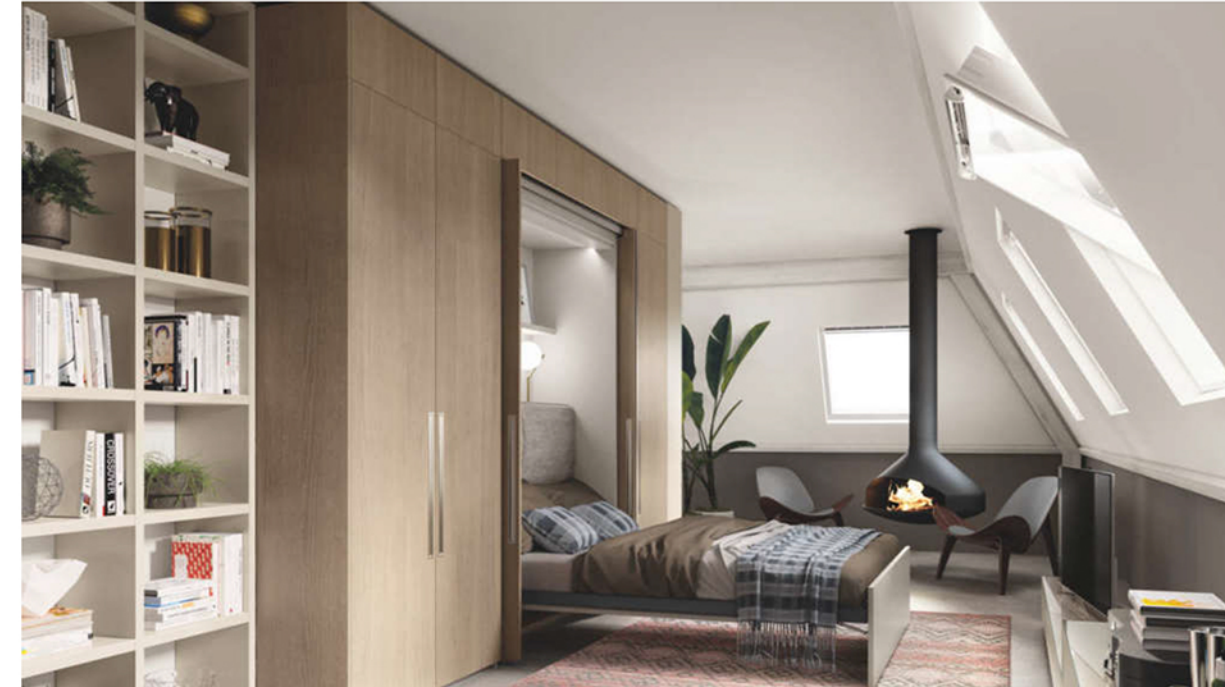
La zona notte creata con BoxLife per l'elegante attico

Il cuore del progetto di BoxLife risiede nell'idea del nascondere per organizzare: dai grandi loft ai piccoli monolocali, uno stesso ambiente può trasformarsi in un altro attraverso la convivenza di spazi diversi con soluzioni lineari, ad angolo o a golfo dove protagoniste indiscusse sono le pannellature. L'accesso alle differenti aree funzionali è reso possibile da sistemi di apertura a scomparsa, a pacchetto, scorrevoli o a ribalta , dagli armadi con anta a scomparsa (singola o doppia) in cucina - che possono contenere sino a quattro elettrodomestici , un piano di lavoro supplementare scorrevole, oltre a numerosi ripiani e cassetti contenitori - ai sistemi scorrevoli per la zona living, agli armadi della zona notte , senza dimenticare la zona lavanderia .