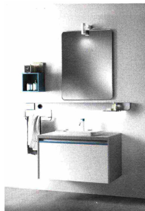
Collezione Dandy Plus di Scavolini firmata da Fabio Novembre. Il sistema di arredo interattivo e digital

Punto di partenza del progetto Dandy Plus è stata la scelta di rivolgersi alle necessità delle nuove generazioni, sempre connesse in abitazioni via via più conte-