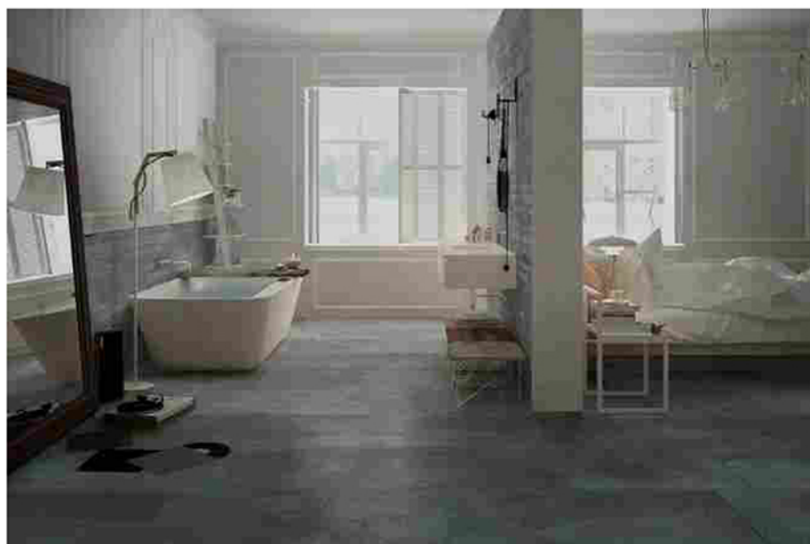
Rivestimenti effetto pietra di Cercom, Gruppo Romani

Insomma, il bagno di casa si arreda come un salotto . O come una cucina: ad esempio il programma Diesel Open Workshop di Scavolini (nella foto di apertura), porta avanti le stesse atmosfere di decisa ispirazione industrial in entrambi gli ambienti, tutti giocati tra bagliori metallici oggi di grande attualità. Lo confermano le ultime tendenze ceramiche (link) e i trend dell'arredobagno (link): l'attenzione è sui materiali declinati in superfici ricercate e sull'armonia dei volumi, decisamente scultorei. Si mantengono linee pure, ma le finiture si arricchiscono e puntano al su misura , in linea con le richieste di personalizzazione che arrivano dal mercato.